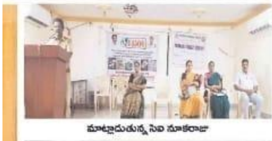
మాట్టారున్న సేవ నూకరాజు