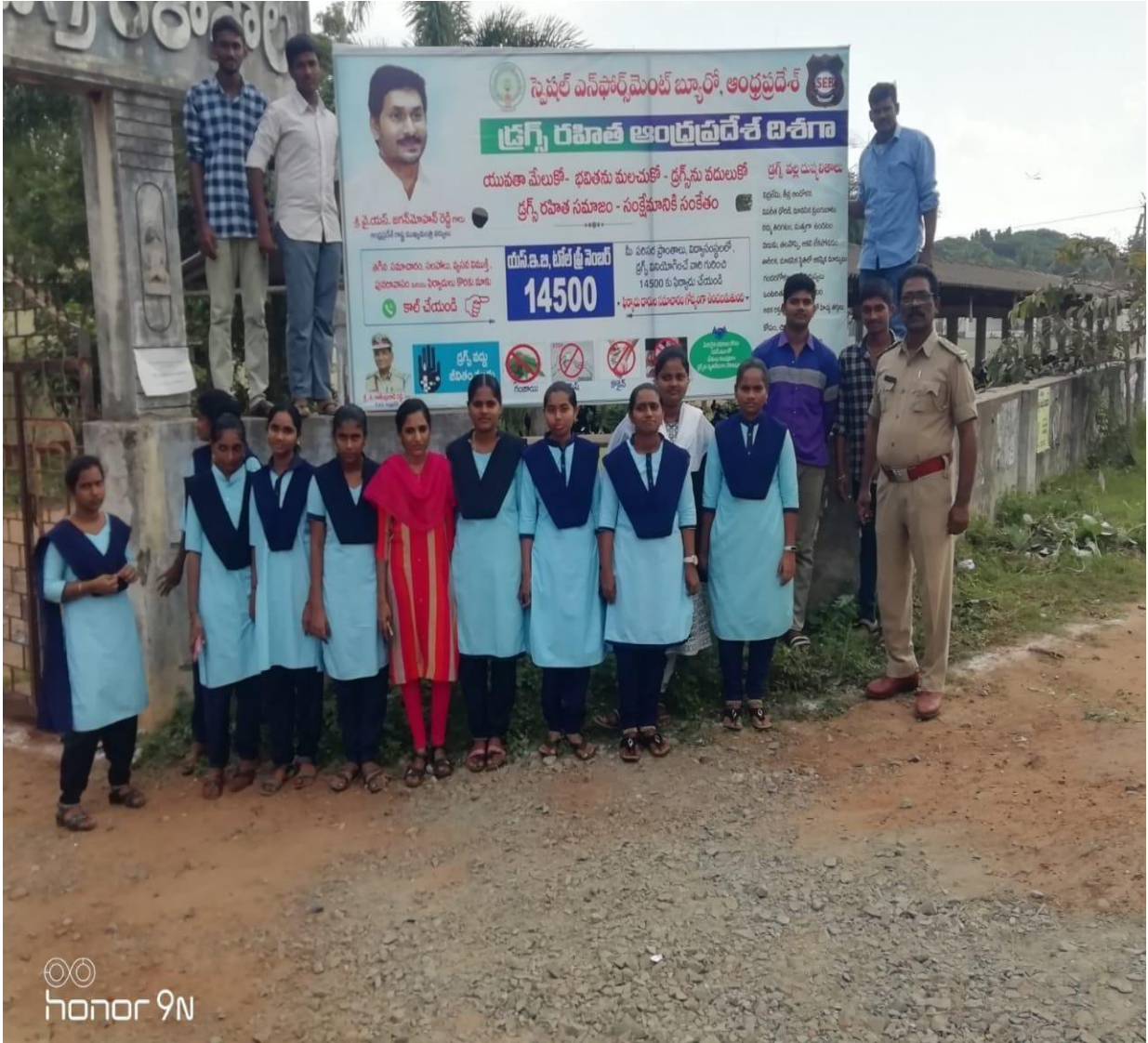
CAMPAIGN THROUGH FLEX