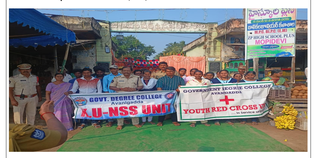
NSS Colunteers at Temple

NSS & Youth Red Cross students serve the devotees on the occasion of Nagula Chavithi at "Shree Valli Devasena Sameta Subrahmanyeshwara Swamy "Temple, located in Mopidevi Mandal, Krishna District on the invitation of the temple staff on 29/10/2022.