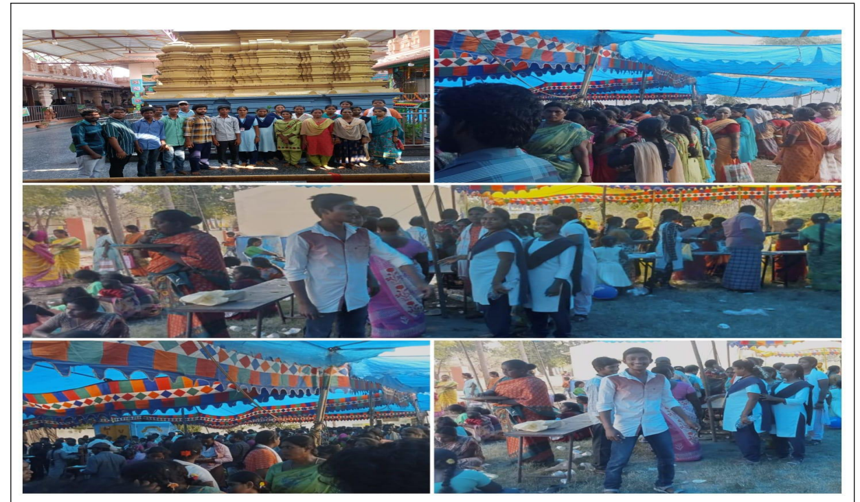
NSS VOLUNTEERS SERVICES AT TEMPLE