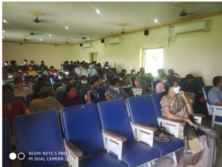
Participated Students in the Program