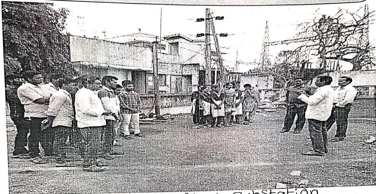
students visited substation