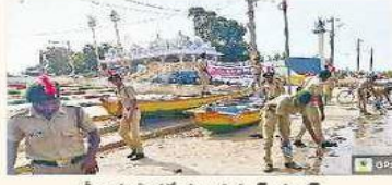
శ్రీ రామపాదక్షేత్రం పుష్కర మాట్ల పరిసరాలను శుభ్రం చేస్తూ..

య లంక, న్యూ టుడె: నీటి కాలుష్య నివారణ కోసం ప్రజల్లో అవగా