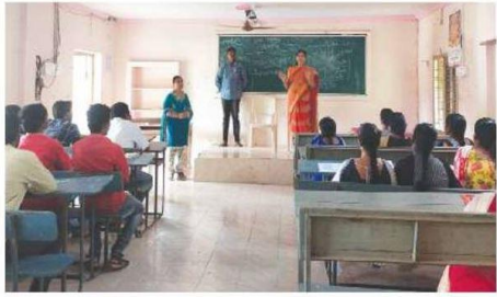
అవగాహన సదస్సులో మాట్లాడుతున్న