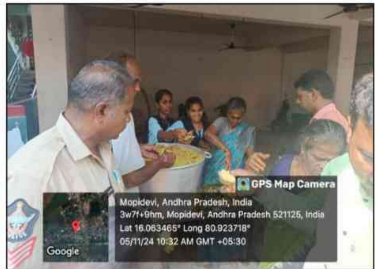
NSS Volunteers participated to service at Mopidevi on 05-11-2024