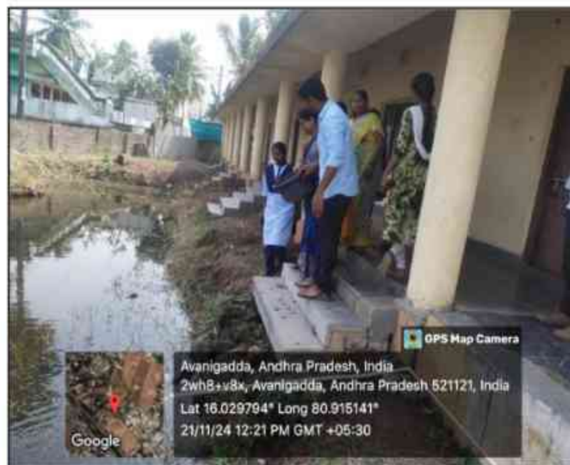
Department of Aquaculture released Fish seed into the Aqua pond on 21-11-2024