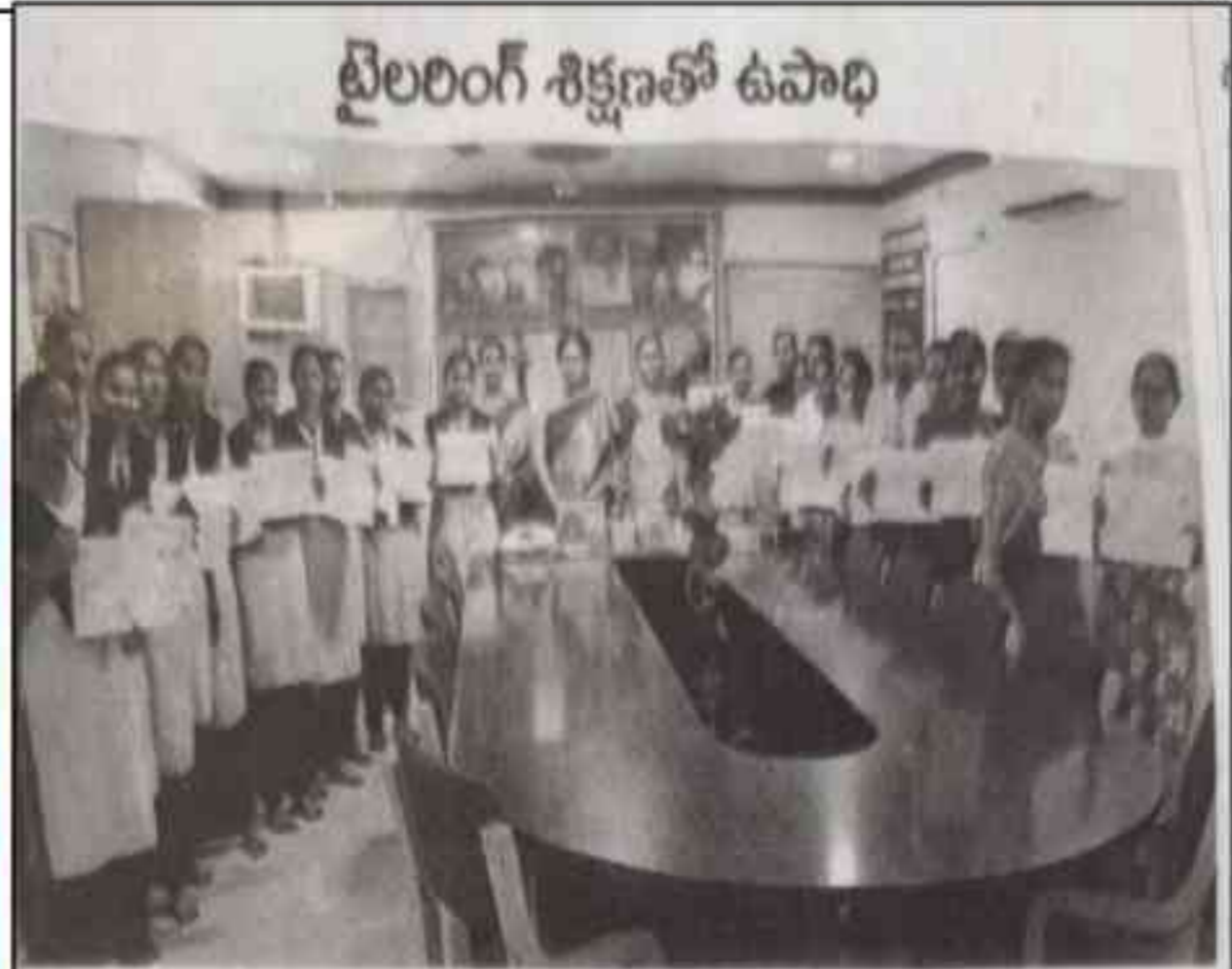
టైలరింగ్ శిక్షణతో ఉపాధి