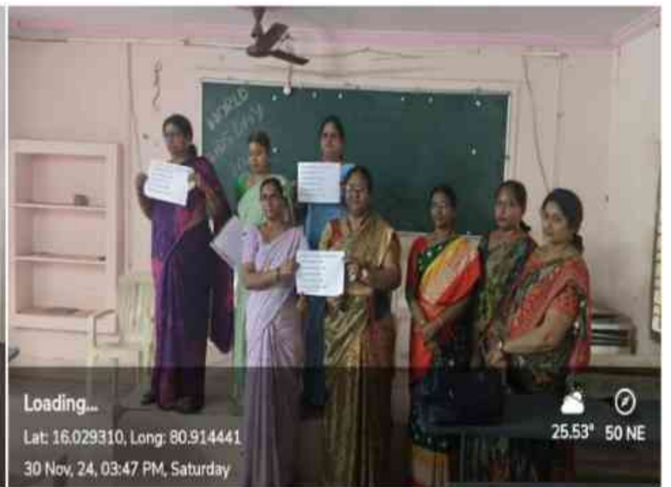
An awareness program on Helpline numbers to all girls students on 30-11-2024