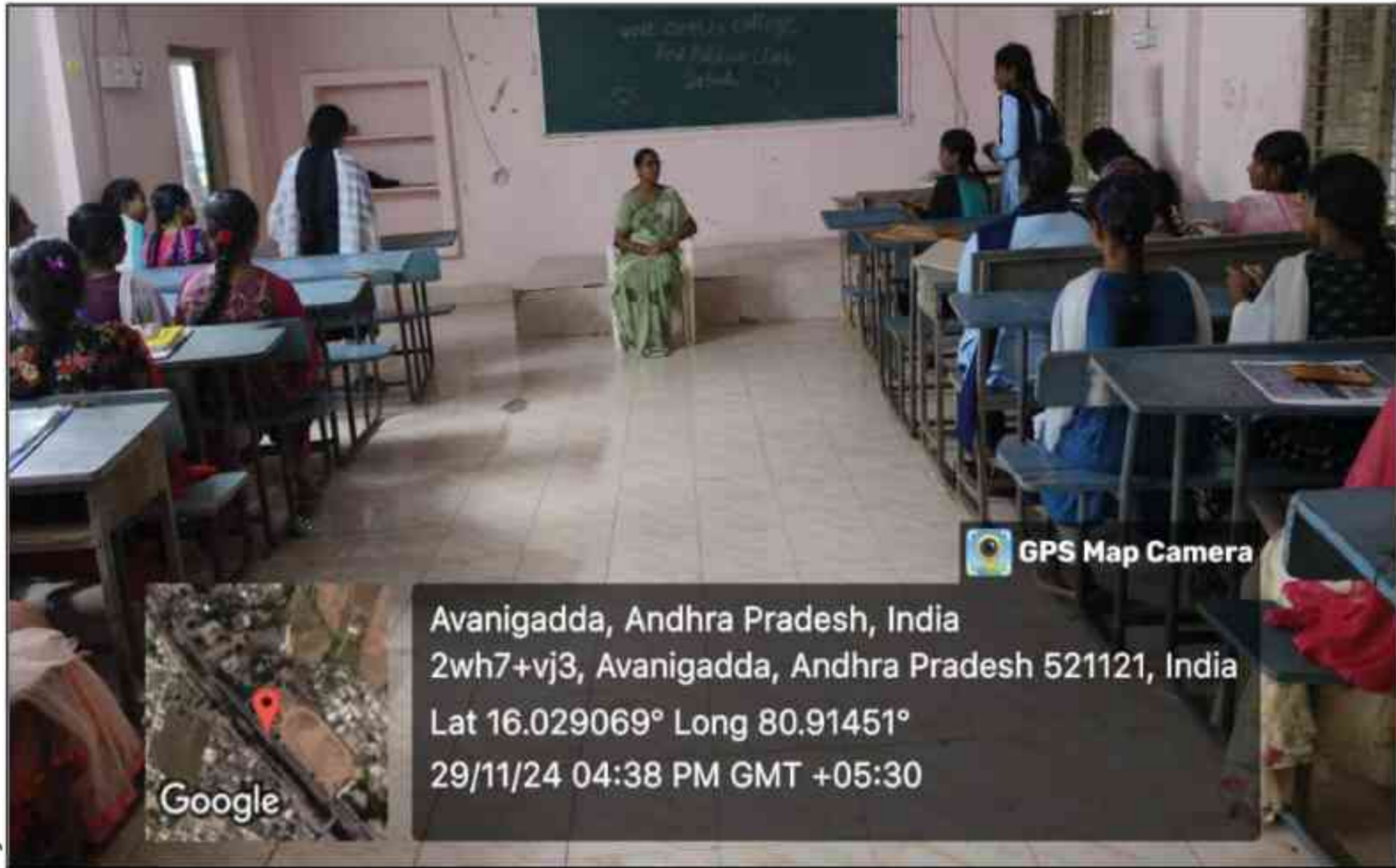
Conducted Debate on HIV eradication requires more funding than climate change initiatives by Red Ribbon Club on 29-11-2024.