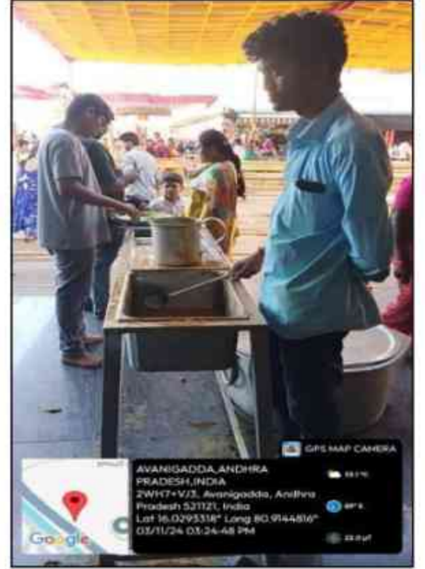
NSS volunteers services provided at Mopidevi temple on 03-11-2024