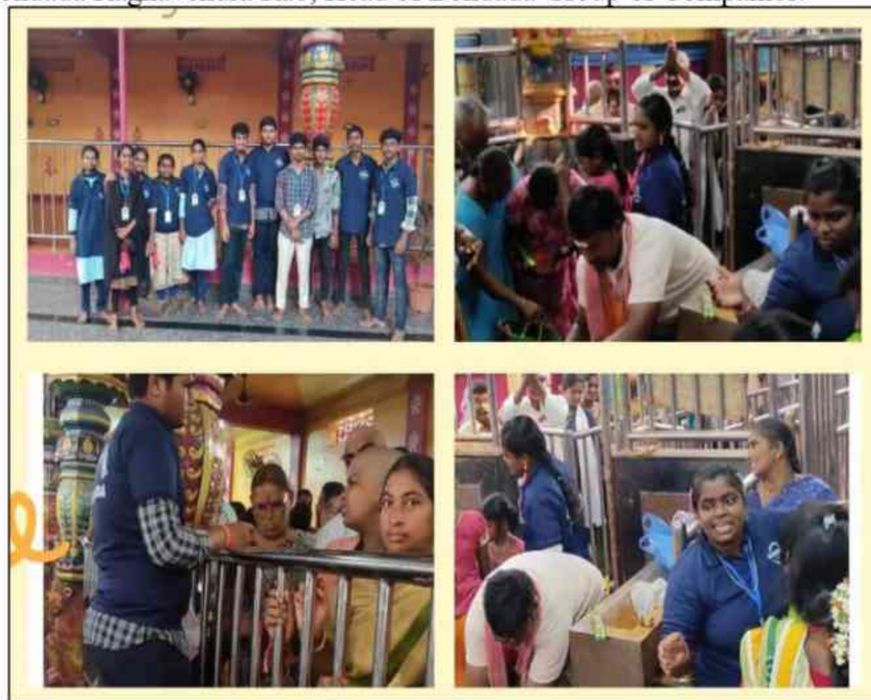
NSS Volunteers services provided at Mopodevi Temple on 17-11-2024