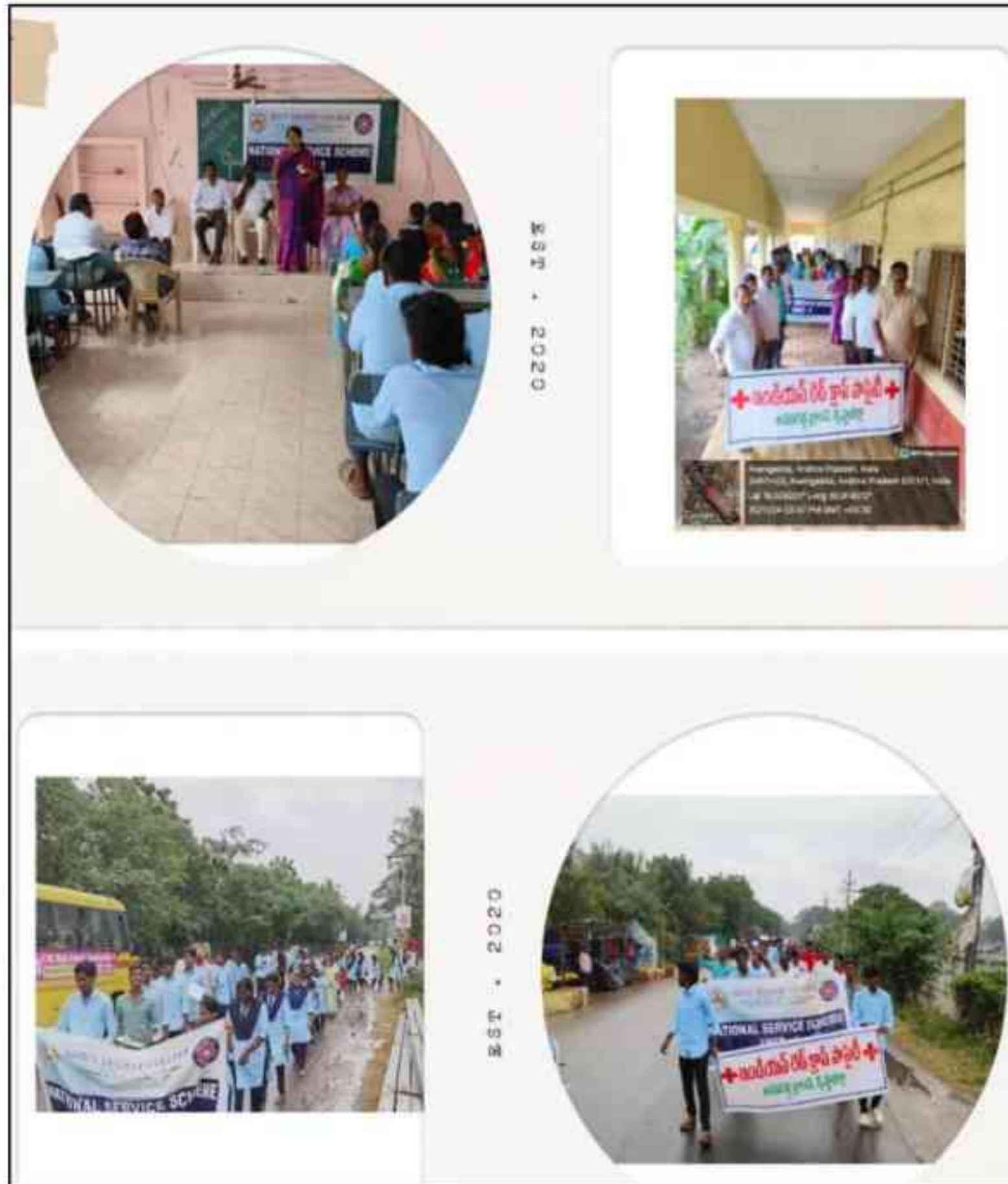
World Aids day Rally on 30-11-2024 organized by NSS and Red Ribbon Club