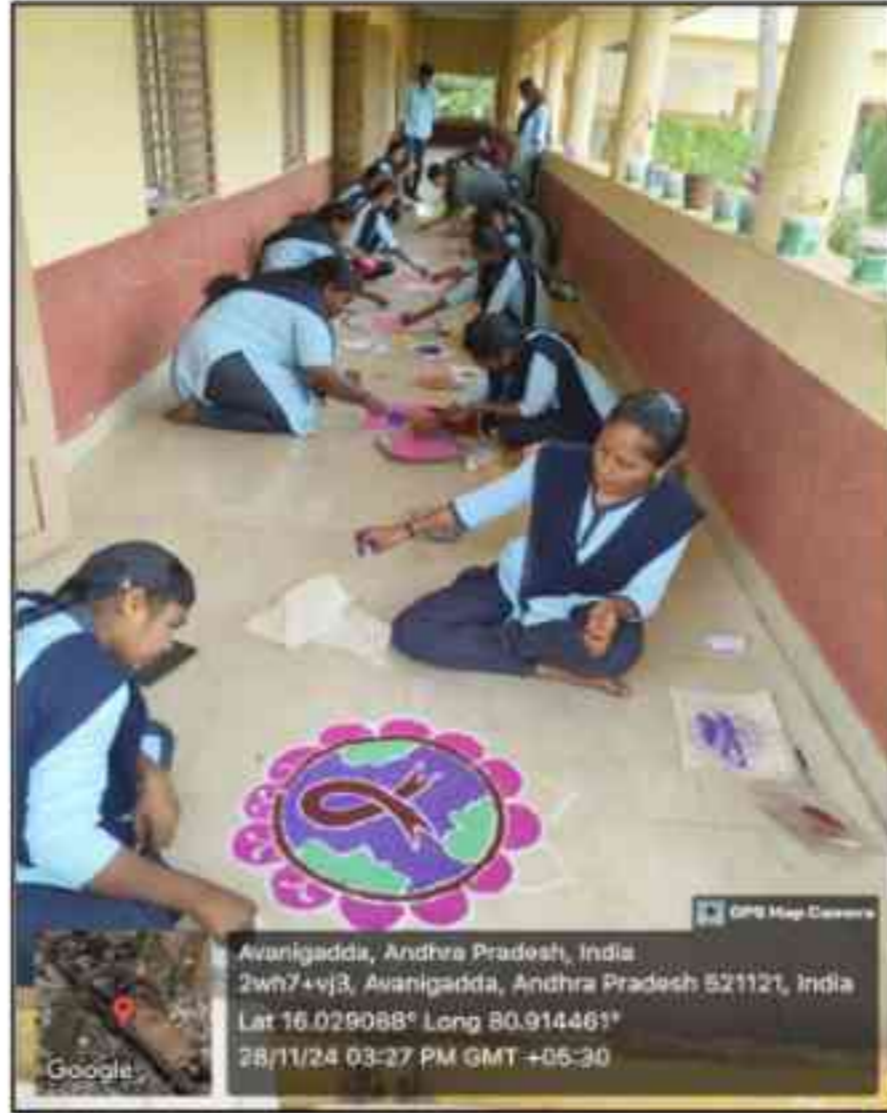
Rangoli competition on occasion of World Aids Day by Red Ribbon Club on 28-11-2024.