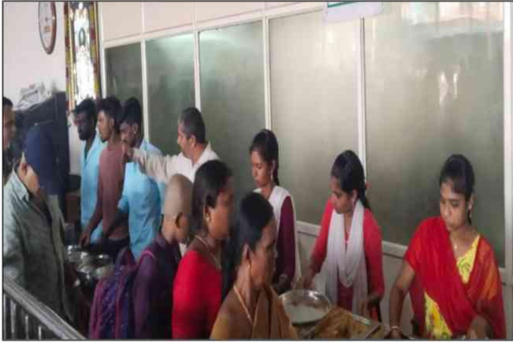
15 NSS volunteers attended to provide service at Mopidevi on 24-11-2024