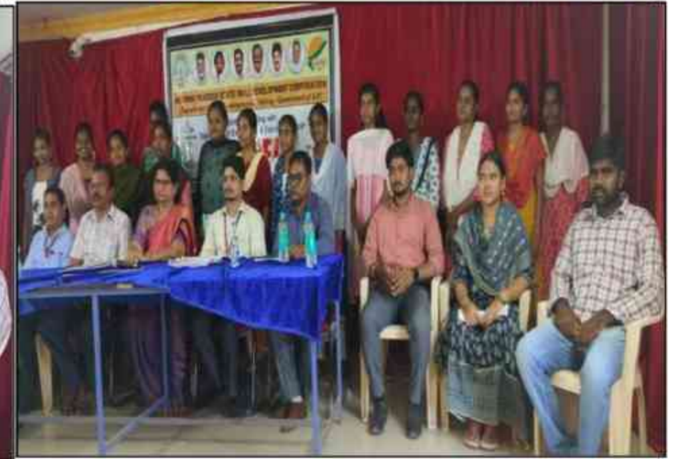
Mini Job Mela on 02.11.2024 organized by APSSDC- Krishna District in GDC, Avanigadda