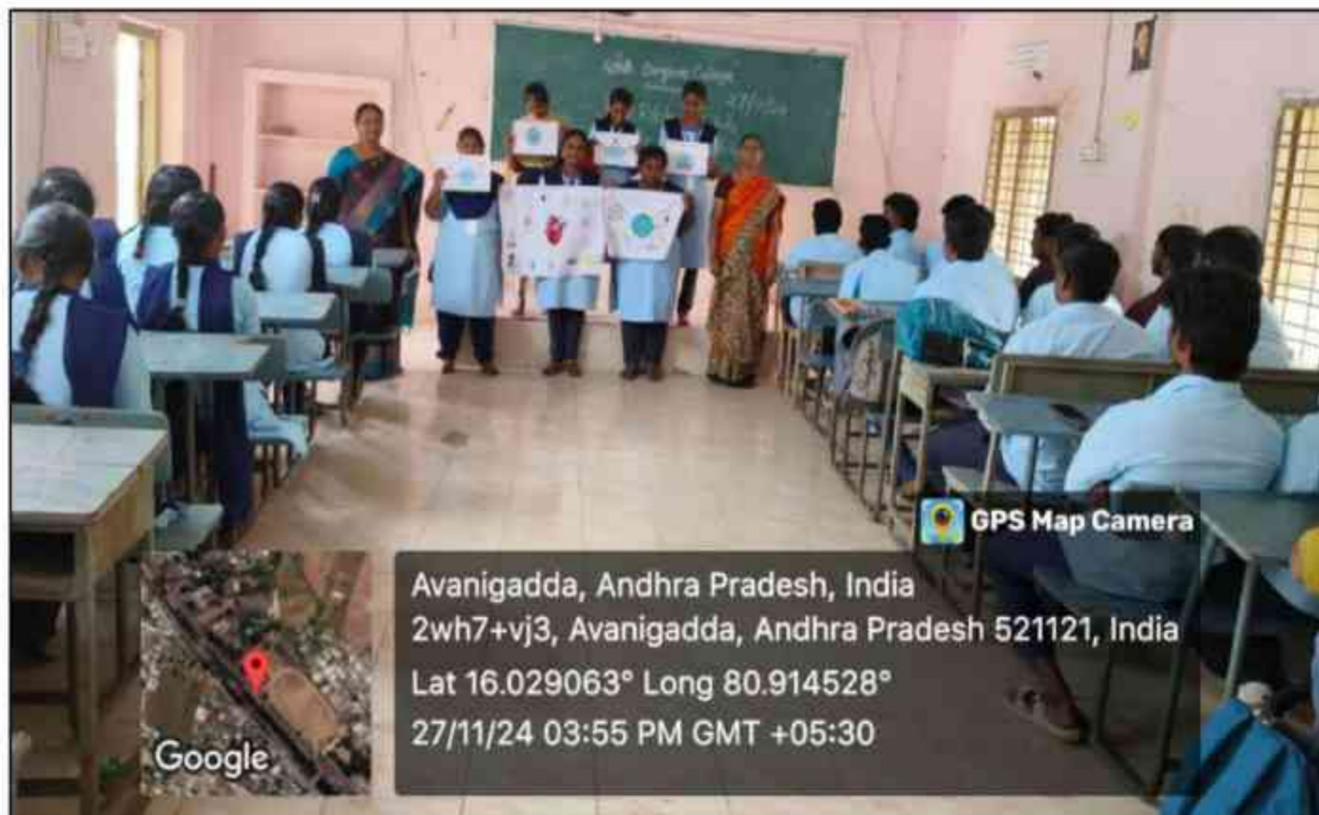
Poster presentation programme on WORLD AIDS DAY Theme: MY Health - My Right organized by Red Ribbon Club on 27-11-2024.