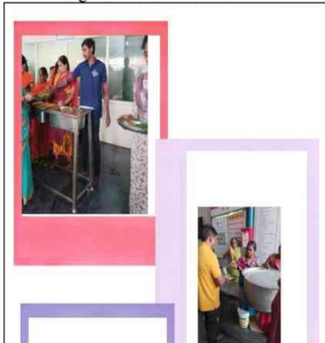
NSS volunteers provided services at mopidevi temple on 29-11-2024