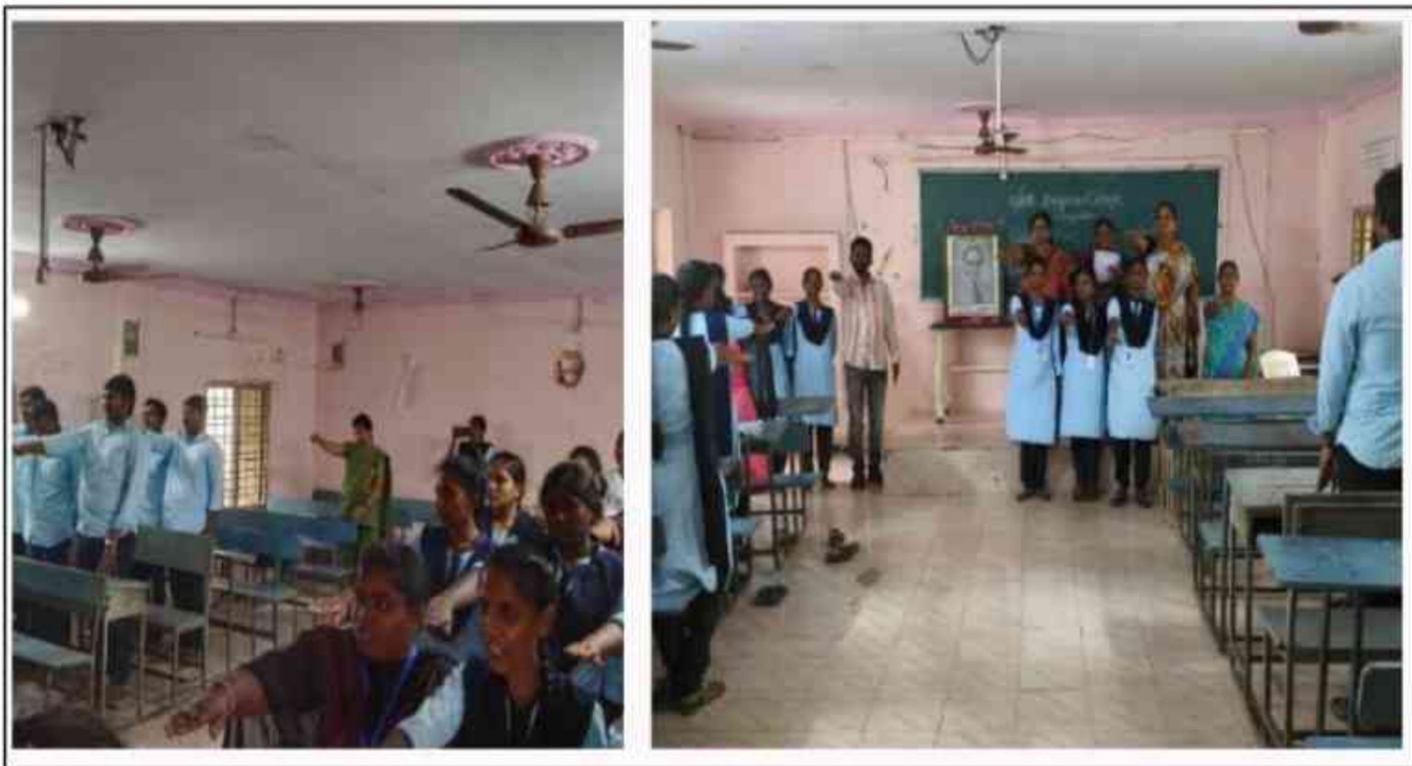
Celebrated 75 th Constitution Day on 26 th November 2024 with the pledge practiced by the students.