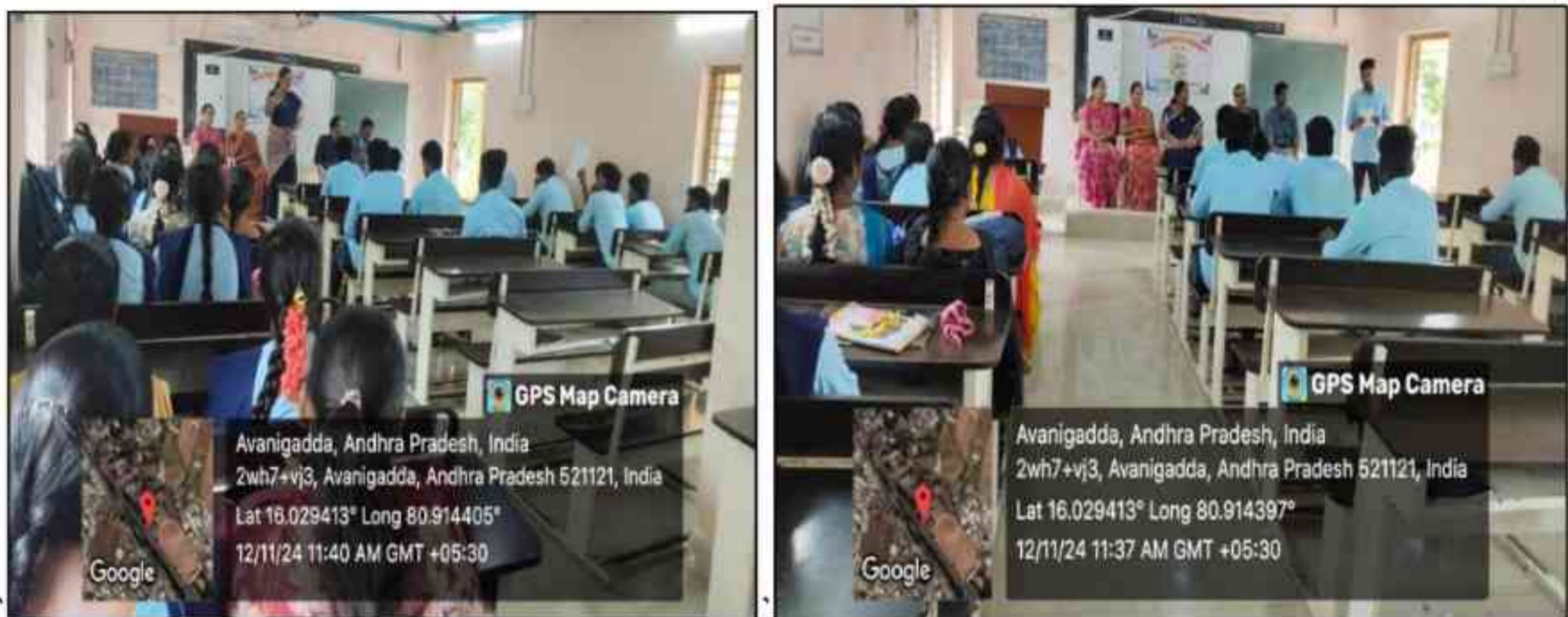
Department of commerce organized "Extempore on Accounting topic by students & staff" on International Accounting day ( 10-11-24, i.e sunday) on 12-11-24 at R.no 19