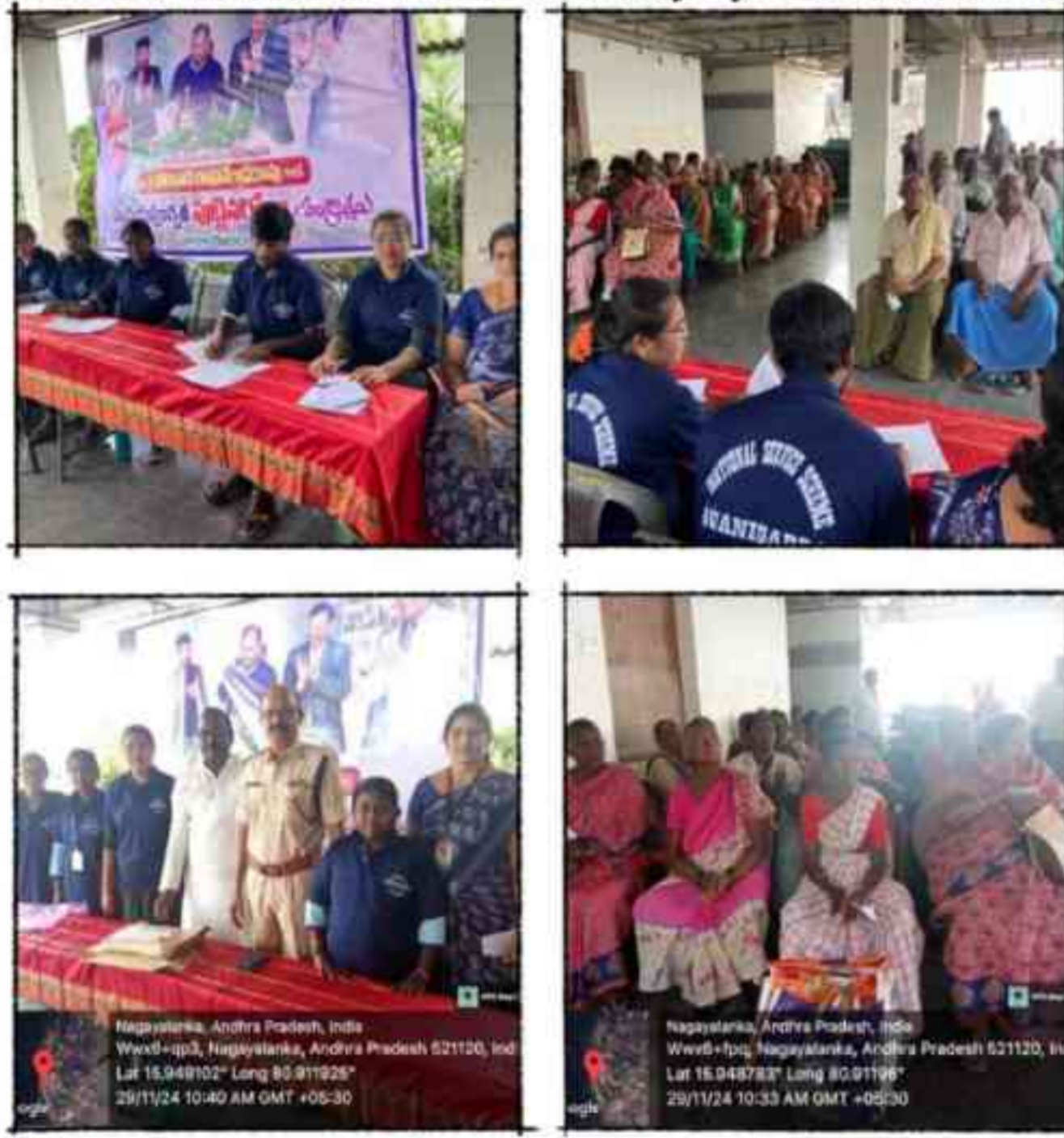
Youth Red Cross volunteers provided services at eye-camp in Nagayalanka organised by Bondada group of companies in association with IRCS Avangadda branch on 29-11-2024.