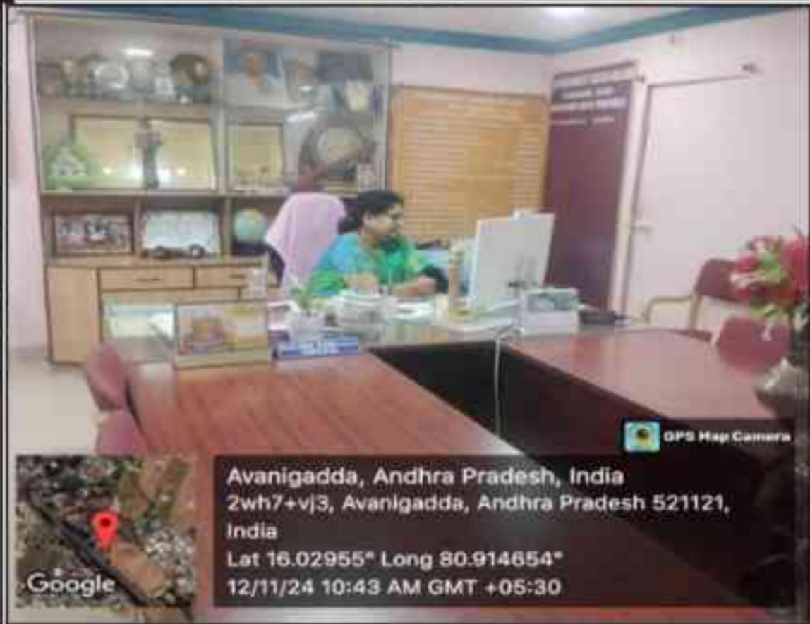
The Department of Computer Science organized one day national Webinar Python Essentials: From Foundations to Data Science Applications on 12-11-2024