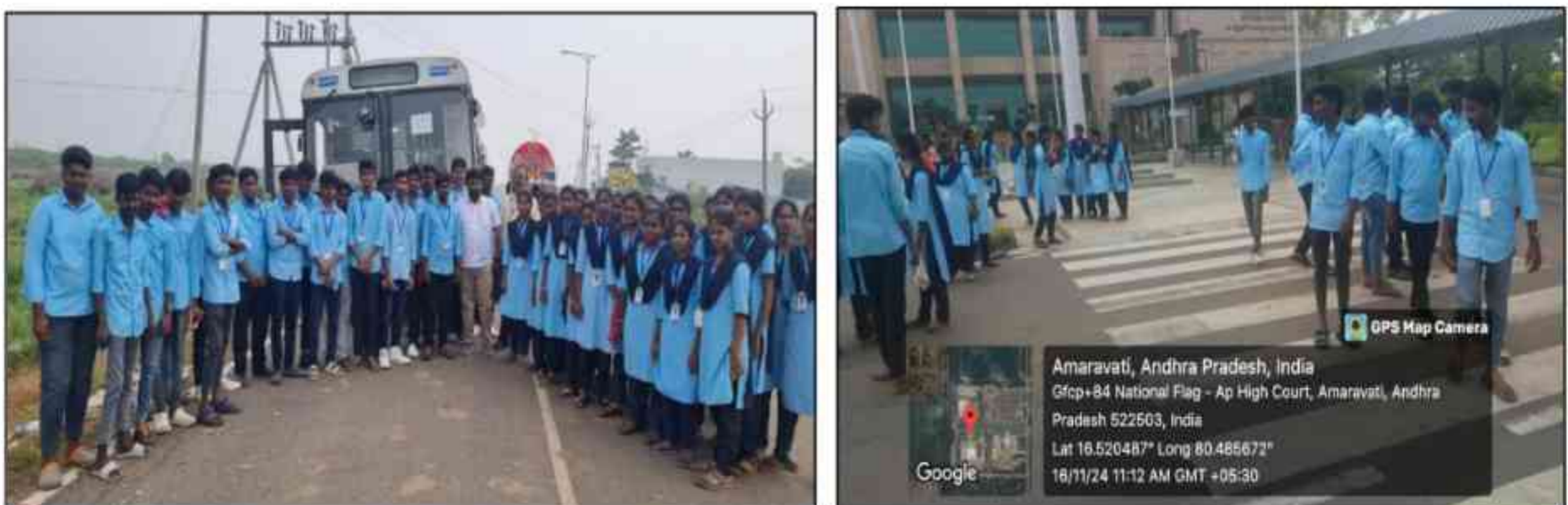
Students Visited Legislative Assembly on 16-11-2024 at Amaravati