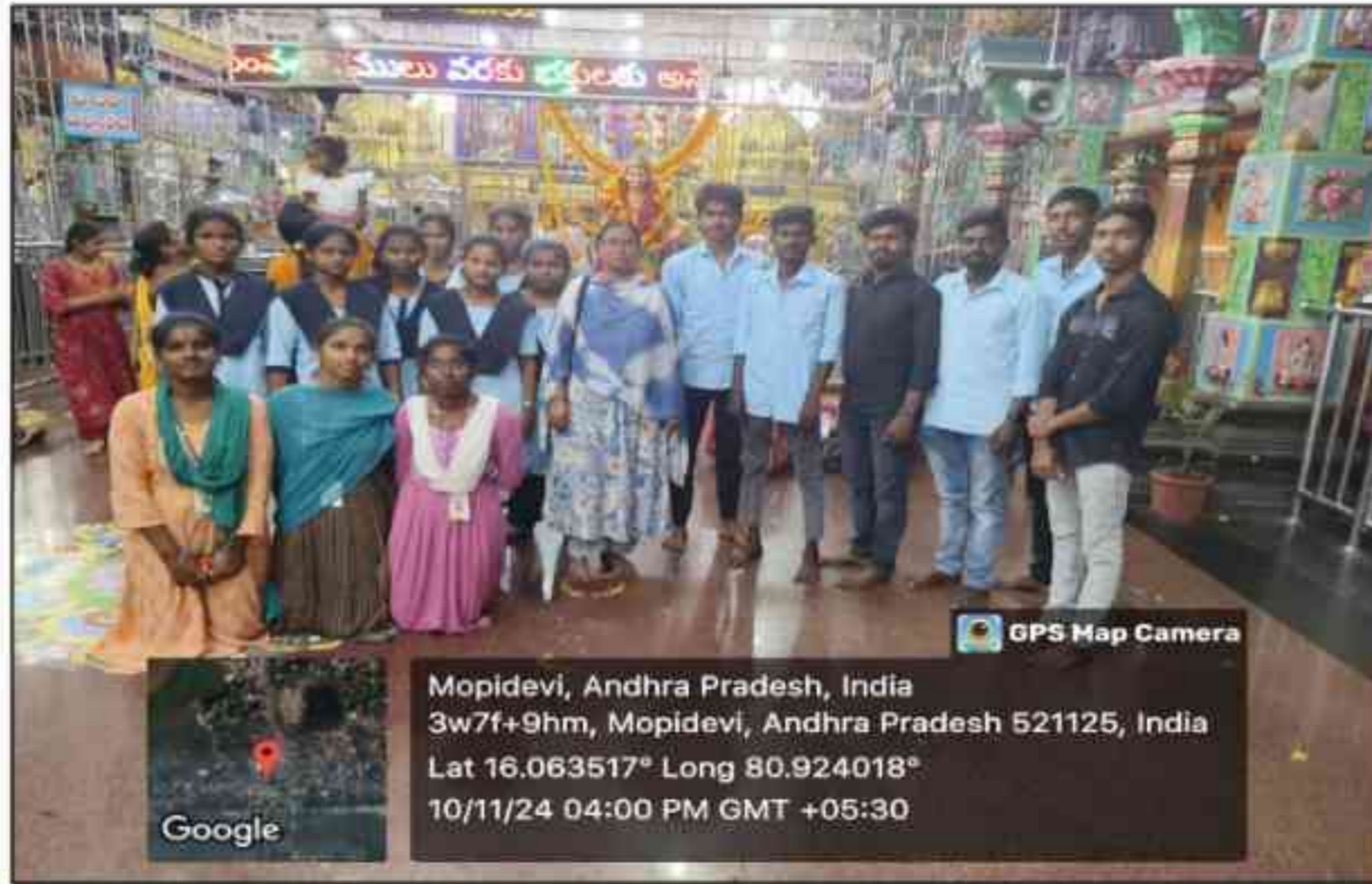
21 NSS Volunteers participated to service at Mopidevi on 10-11-2024