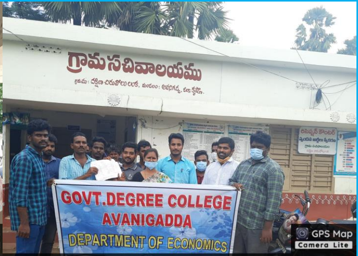
Diviseema, Andhra Pradesh 521121, India

Latitude 16.035579764284194° Longitude 80.95781701616943° Local 11:41:19 AM Altitude -132 meters GMT 06:11:19 AM Saturday, 13-11-2021