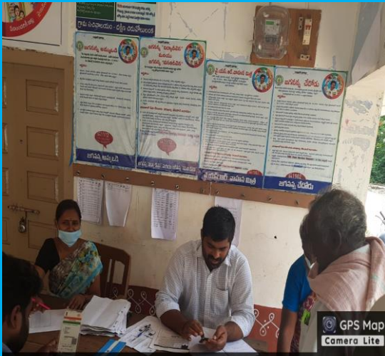
Diviseema, Andhra Pradesh 521121, India

Latitude 16.035579764284194° Longitude 80.95781701616943° Local 11:41:19 AM Altitude -132 meters GMT 06:11:19 AM Saturday, 13-11-2021