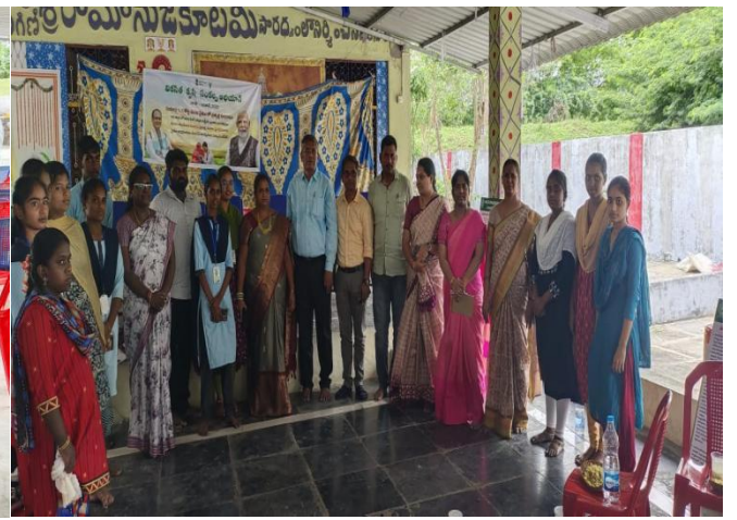
29 of this month, 15 BA students attended the Vikasita Sankalpa Krishi Yojana awareness program in Vekanur and interacted with scientists from Acharya Nagarjuna University, Sugarcane Research Center, Oil Farm Research Center, and Krishi Vigyan Kendra.