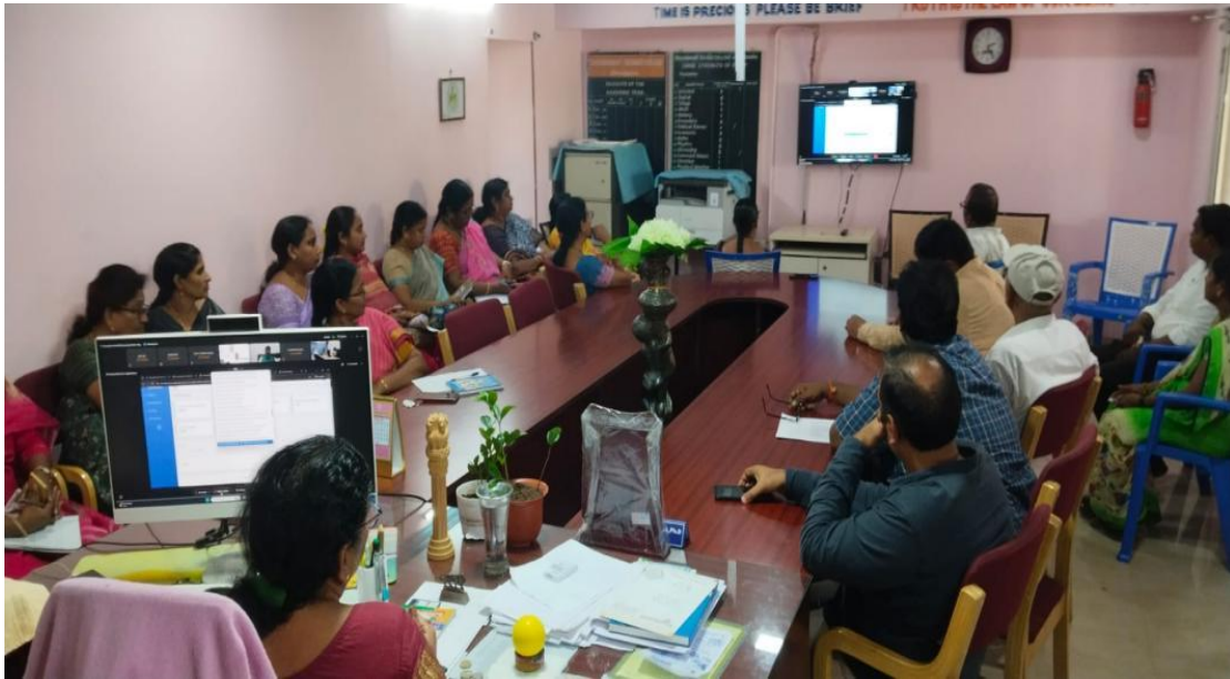
Principal and all Teaching Staff members has participated in CSP Survey Meeting Conducted by CCE office through Online on 09-05-2025