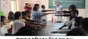
పొగాకు వ్యతిరేక ప్రతిజ్ఞ చేస్తున్న విద్యార్థులు