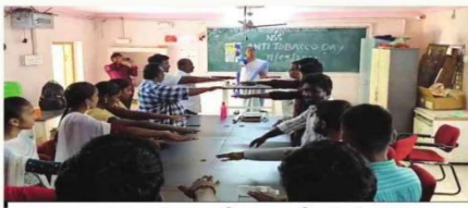
అధ్యాపకులు, సిబ్బంది చేత ప్రతిజ్ఞ చేయిస్తున్న ధృక్పథం