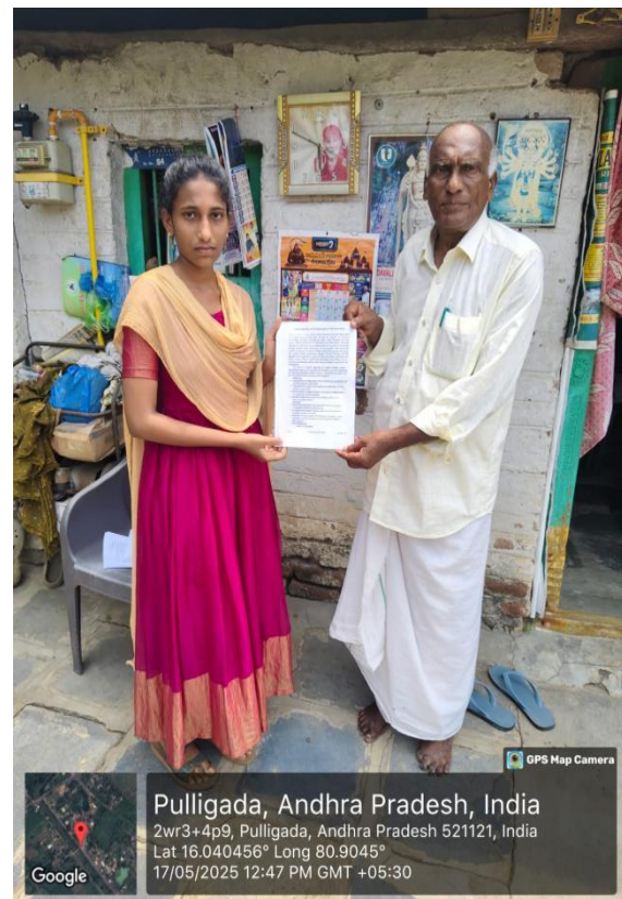
Students collecting data from the Rural area people for Community Service Project (CSP)