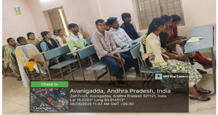
Conduct offline meeting for CSP and internship for B..A