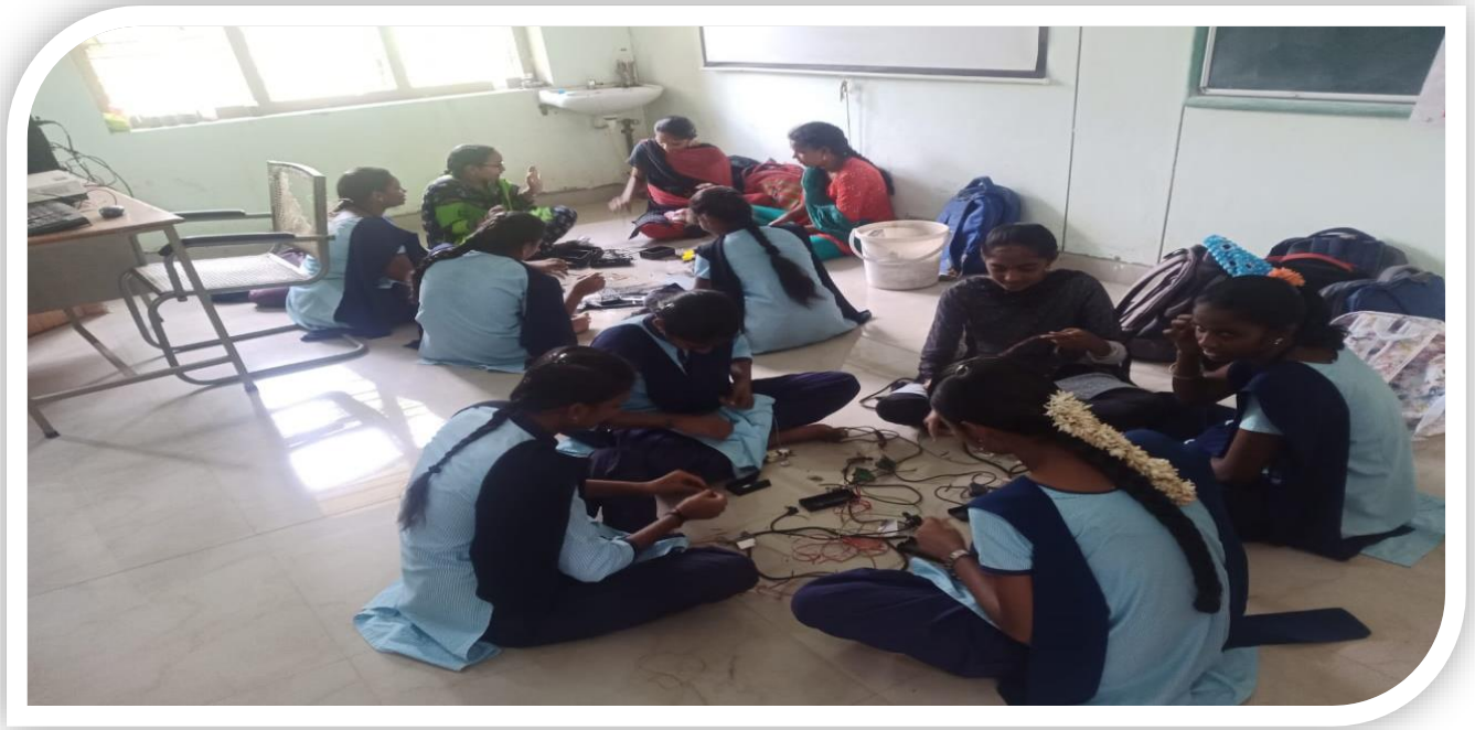
Students extracting copper from cables as a part of E waste Management