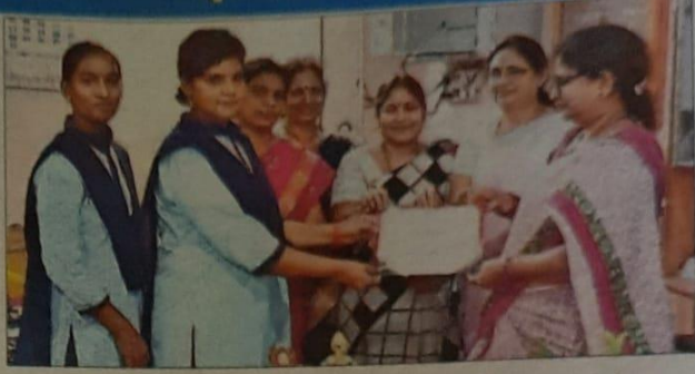
విద్యార్థినులను అభినందిస్తున్న ప్రెస్నిపల్, అధ్యాపకులు