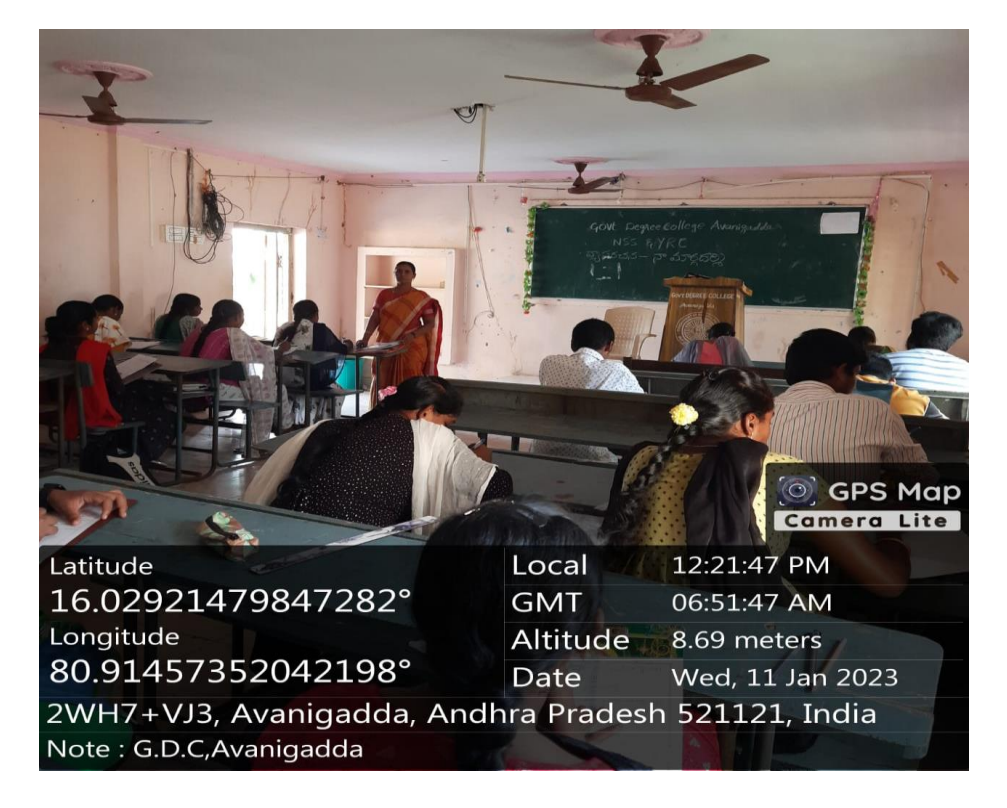
Essay writing on Write about your role modal on 11<sup>th</sup> jan.