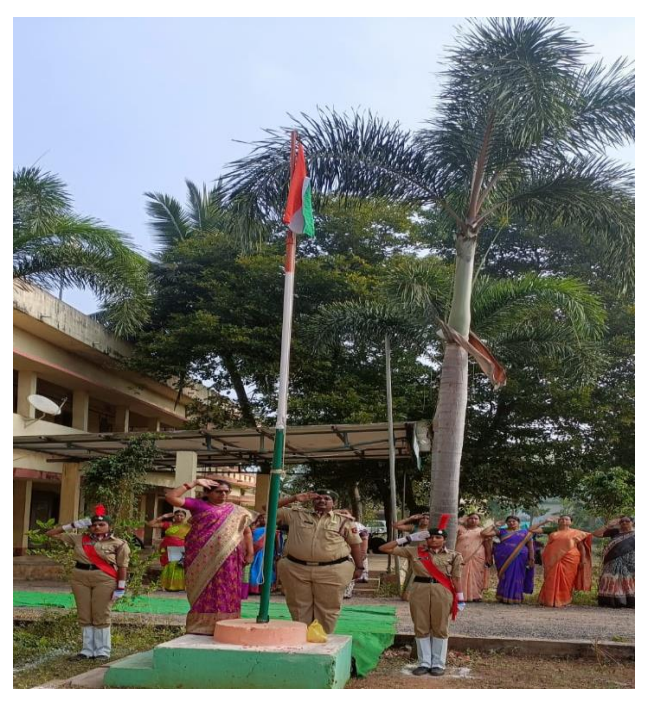
Celebrating 74<sup>th</sup> Republic Day on 26<sup>th</sup> jan