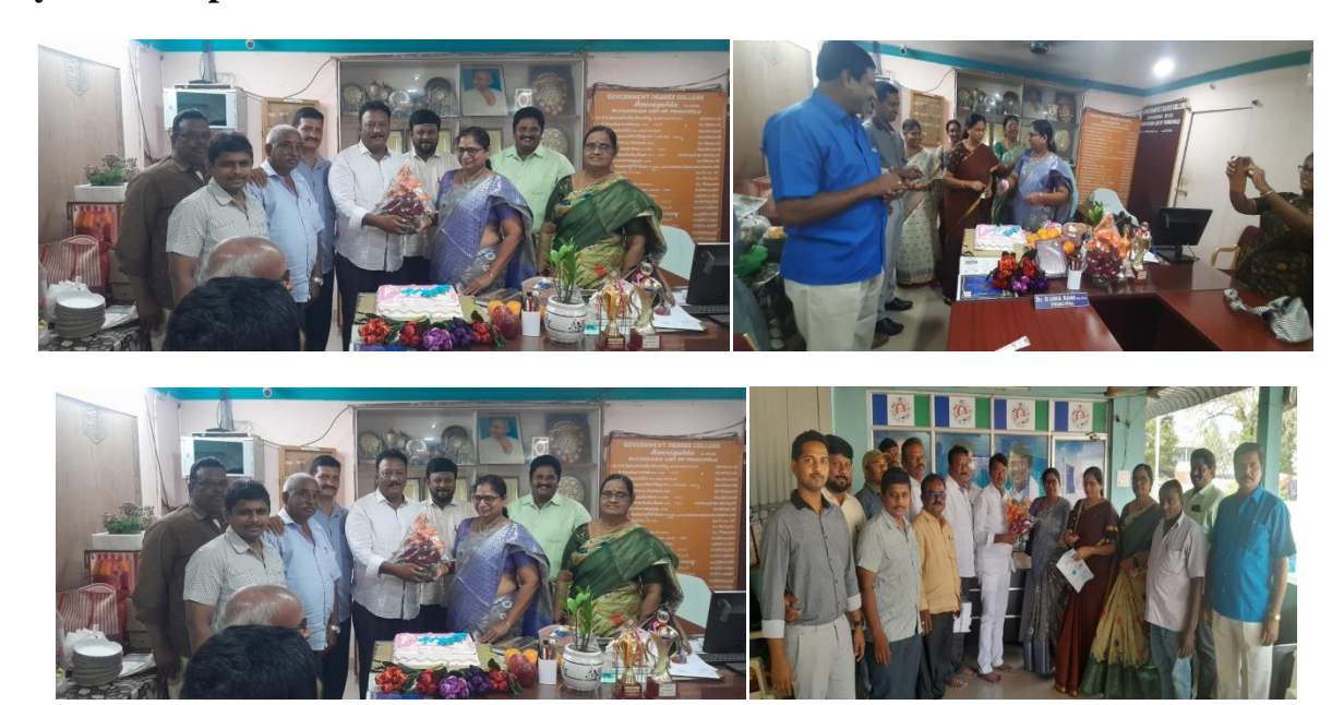
New year celebrations on 2<sup>nd</sup> jan .