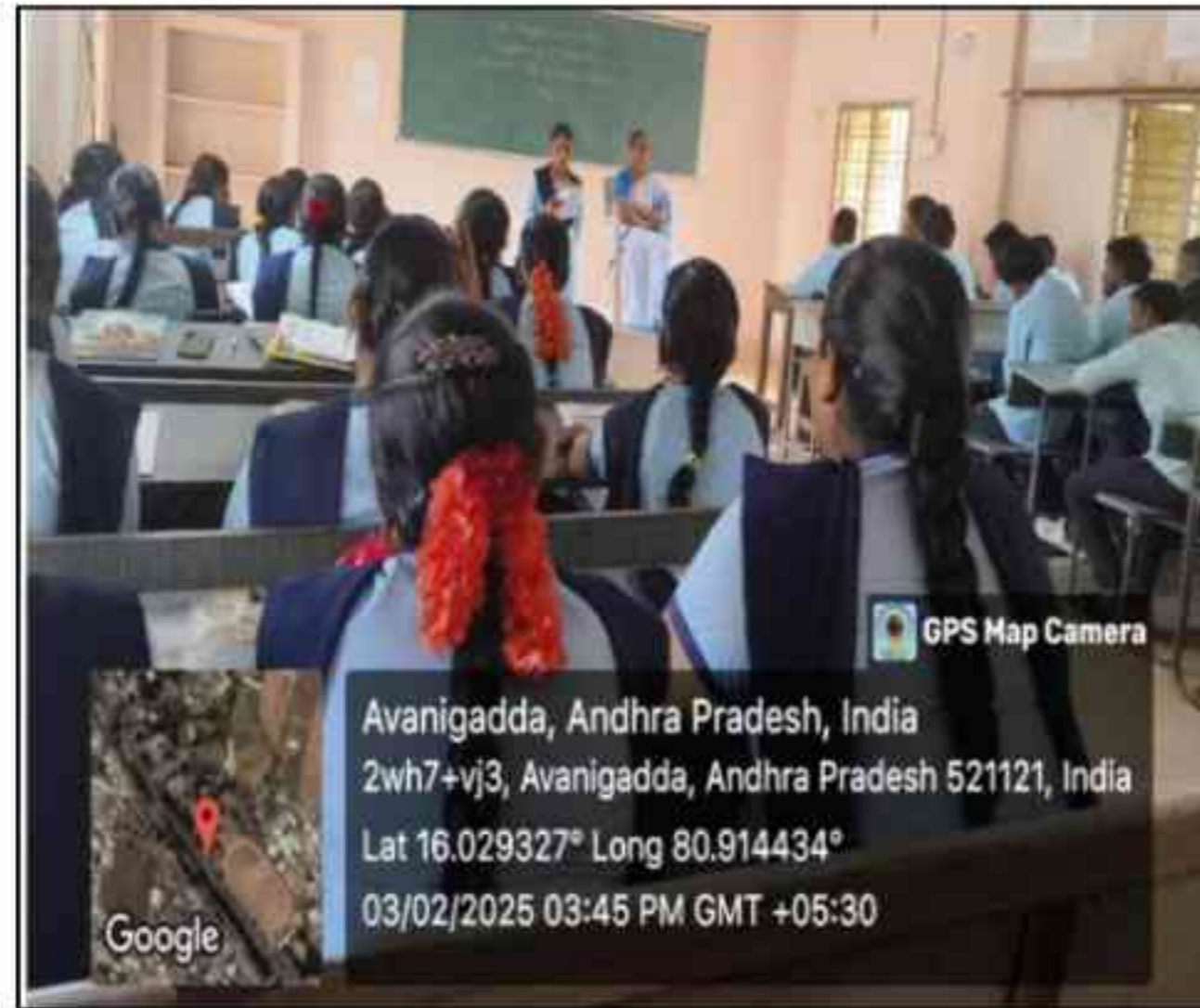
Students Talk on Union Budget 2025-26 on 3/2/2025 by II BA Government Degree College, AvaniGadda students