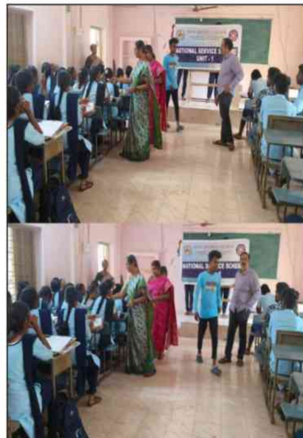
The NSS Unit 1 Distributed Albendazole pills on the occasion of National Deworming Day.