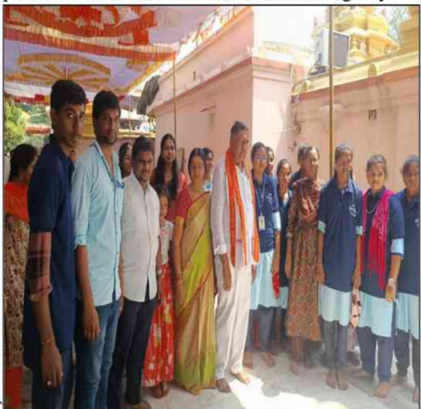
On 26th February 2025, 7 volunteers from NSS Unit 2 and 23 volunteers from the Youth Red Cross provided services at Sri Durga Nageswara Swami Temple, Pedakallealli.