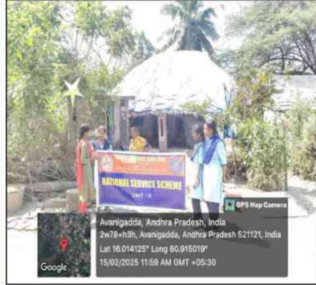
NSS Unit-I and NSS Unit-II Volunteers raising awareness on wet and dry waste treatment on 15-02-2025