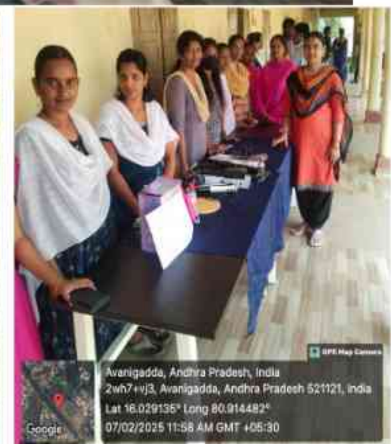
College Traid Fair conducted on 07-02-2025