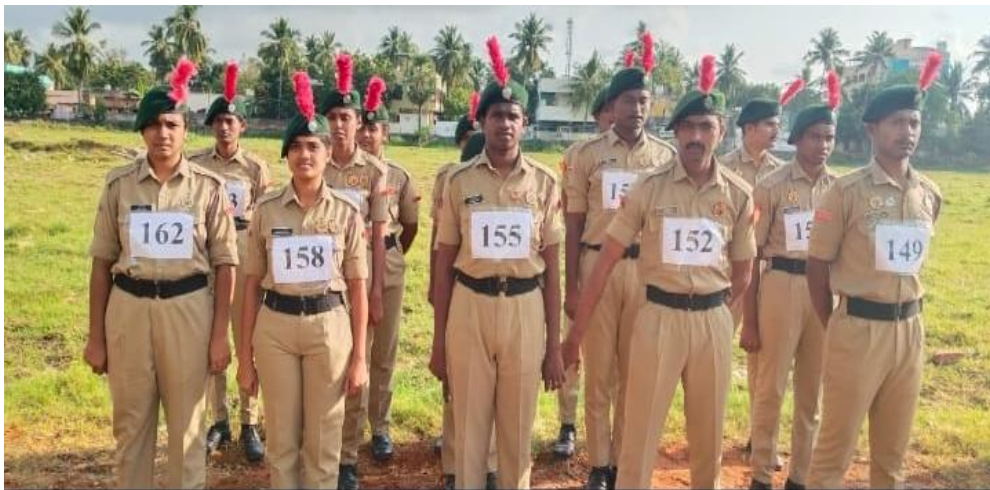
NCC Students attended for NCC B-Certificate Practical Exam at The Hindu College, Machliptnam on 01-02-2024