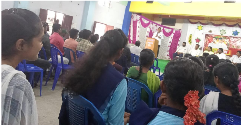
Students attended programme at Gandhi kalakshetram on 19-02-2024