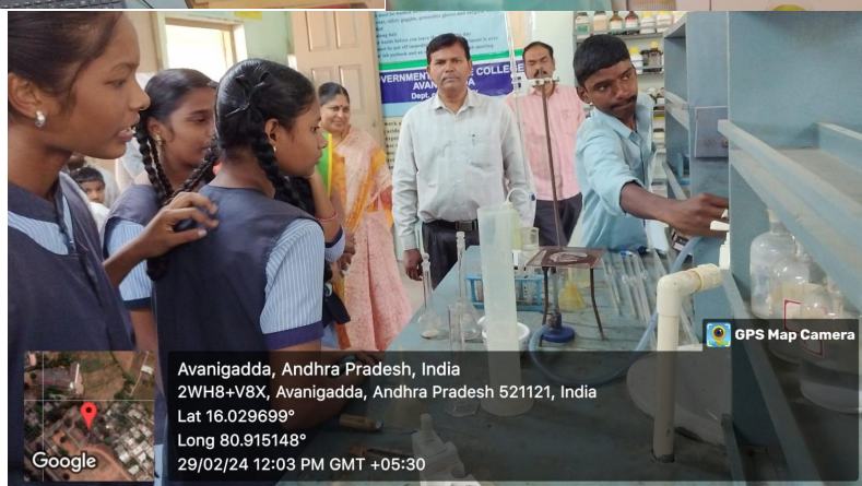
The Department of Chemistry Organized Science Exhibition on 29-02-2024