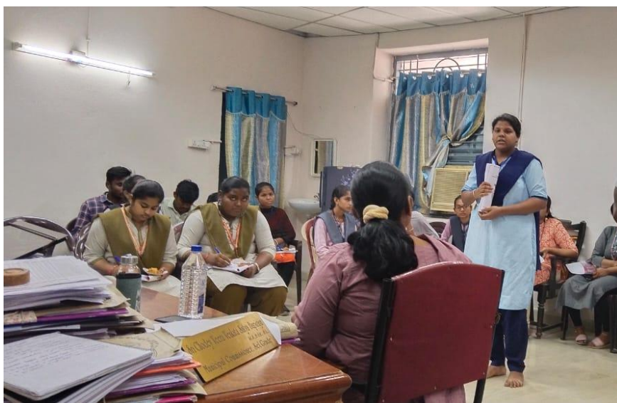
Finial Students Visited Jocol LTD perecherla gunturu dt on 17-02-2024