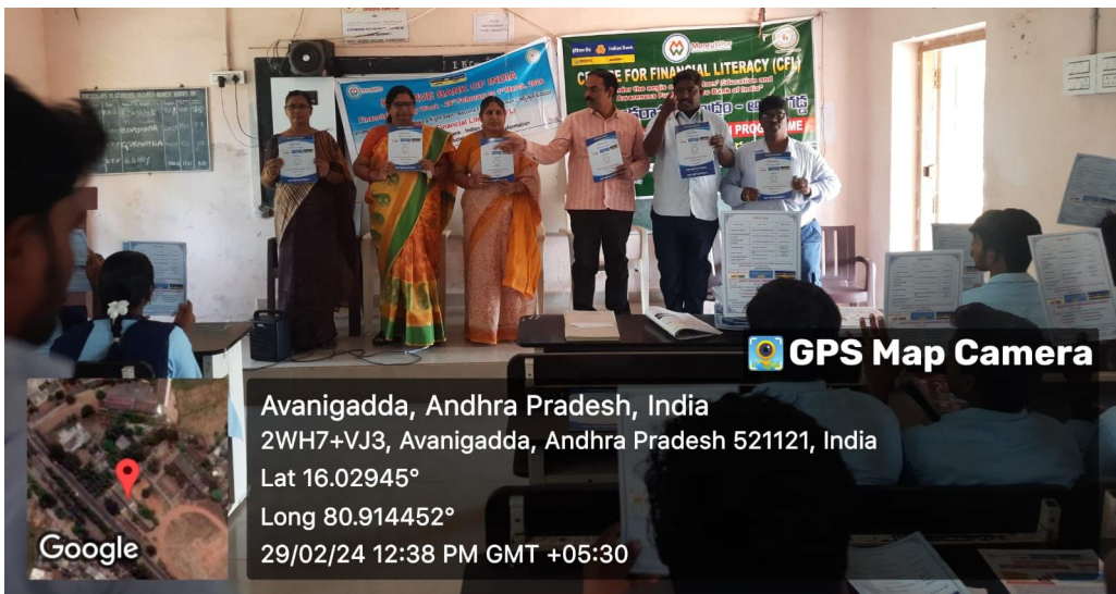
Broacher release on financial literacy week organized by economics department in association with commerce department