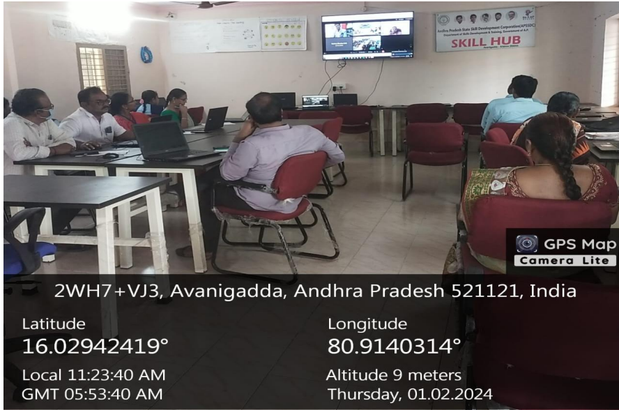
GDC, Avanigadda Staff attended Budget 2024-25 live Meeting on 01-02-2024