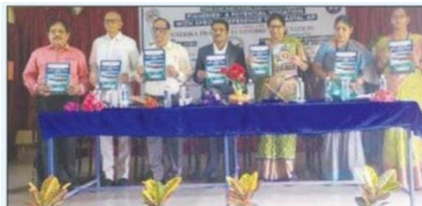
The Department of Economics Organized National Seminar on 21-02-2024

Avanigadda, Andhra Pradesh, India 2WH7+VJ3, Avanigadda, Andhra Pradesh 521121, India Lat 16.029583° Long 80.914895° 21/02/24 03:10 PM GMT +05:30