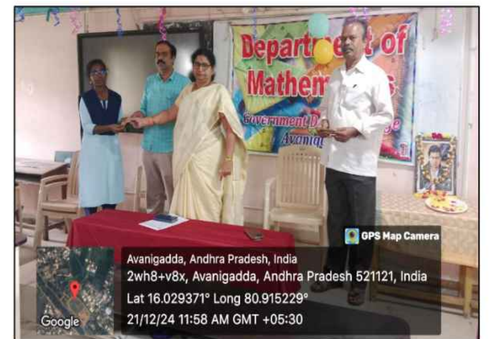
The Department of Mathematics Organized National Mathematics Day Celebrations of 37 th Birthday of Srinivasa Ramanujan a great Indian Mathematician.