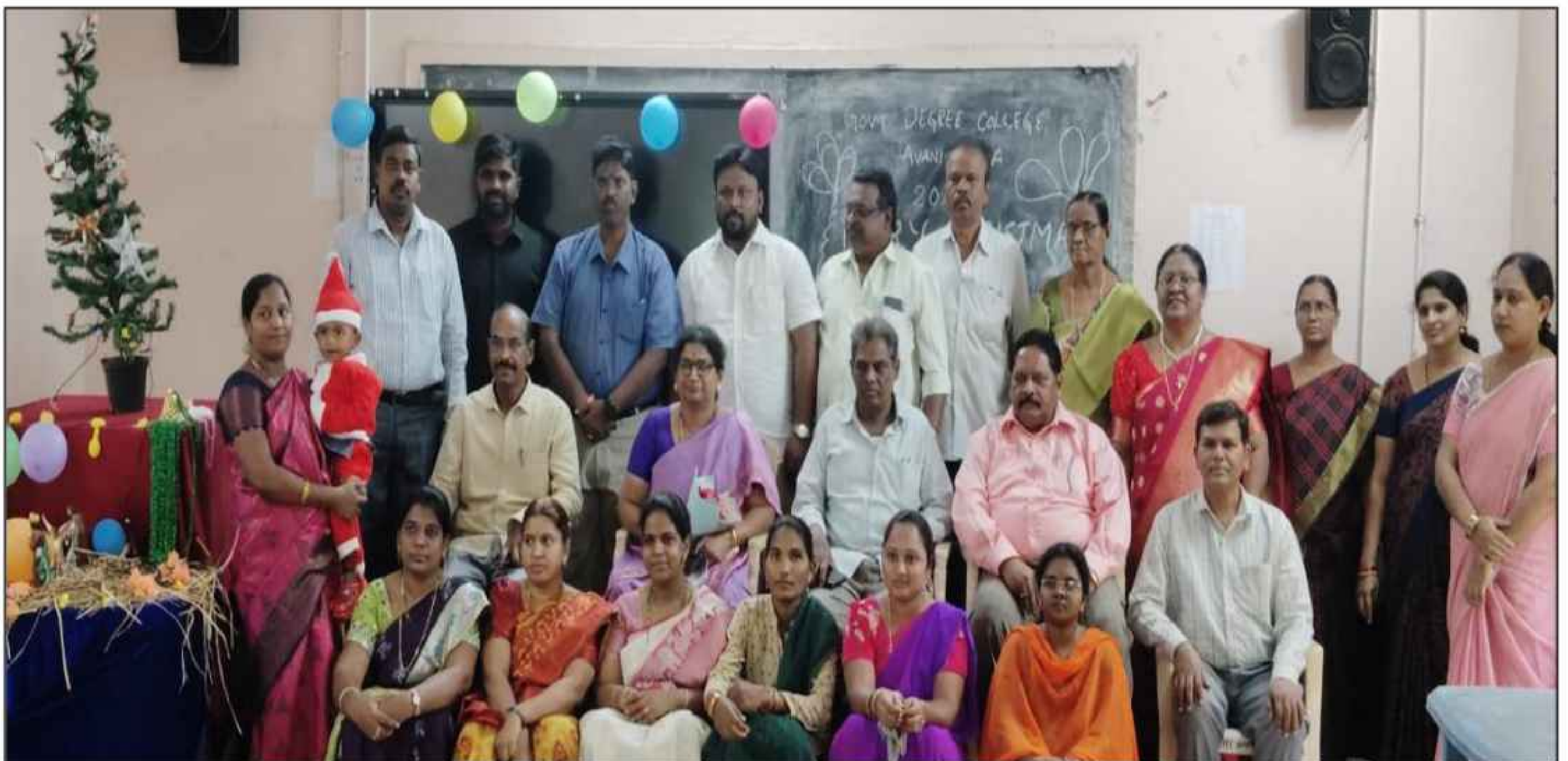
Semi Christmas celebrations in our college on 20-12-2024