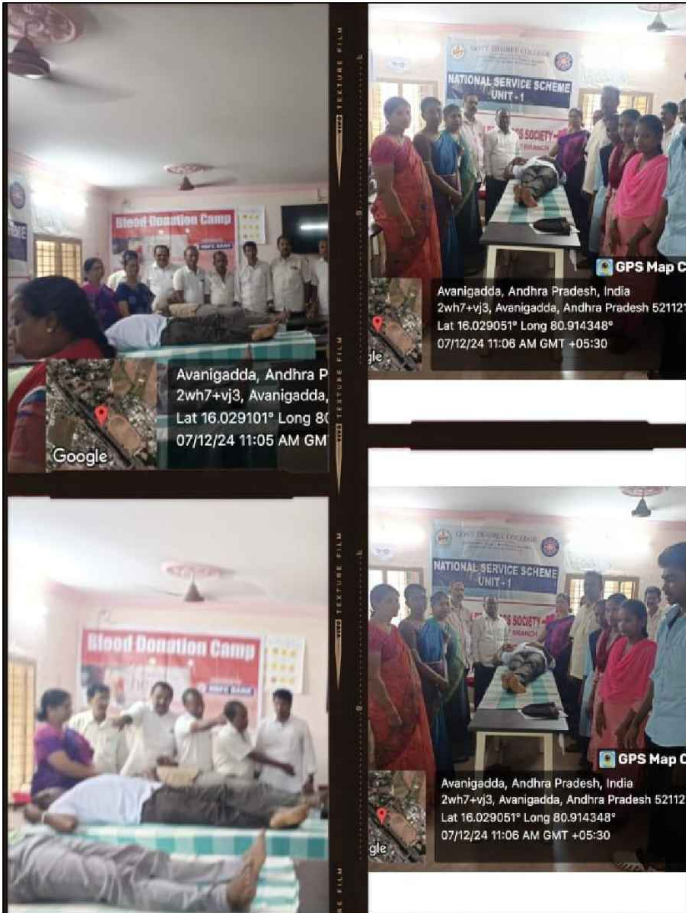
Blood donation camp organised by National Service Scheme unit 1 in association with Indian Red cross society Avanigadda branch on 07-12-2024