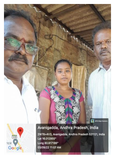
Admission Campaign Dore to Dore

> Participated in vigilance inspection at Sai Degree College, Tiruvuru