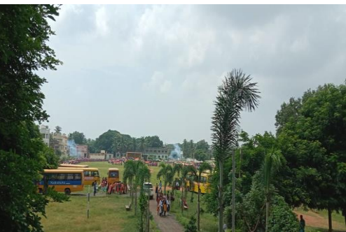
Sports Day Celebrations in GDC-AVANIGADDAs